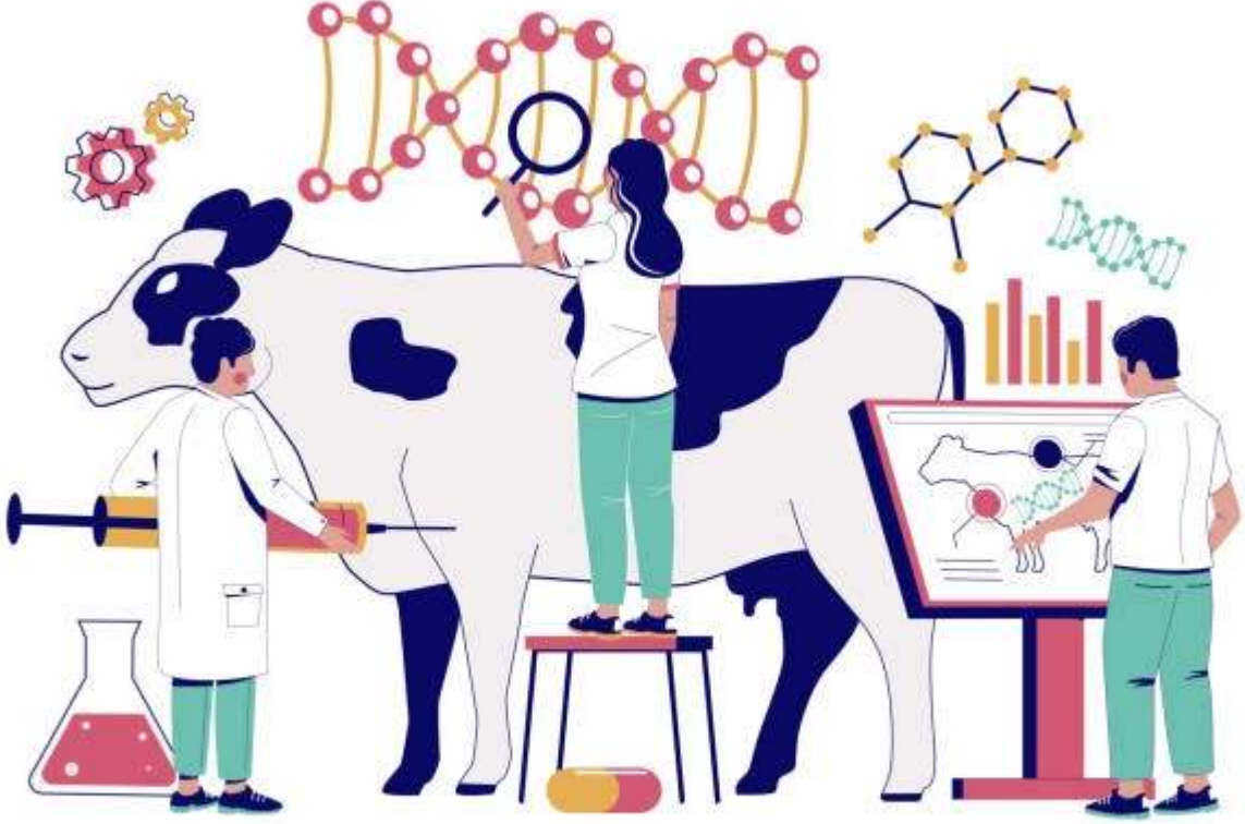
GENETICALLY MODIFIED ANIMALS